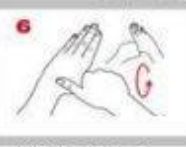
旋轉搓洗雙手 大姆指虎口