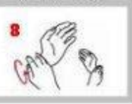
旋轉洗淨雙手手腕