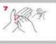
旋轉洗淨雙手指尖