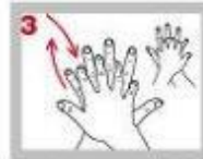
右(左)手心蓋過左(右)手背，由手心到手指互搓