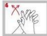
手心對手心 手指交叉互搓